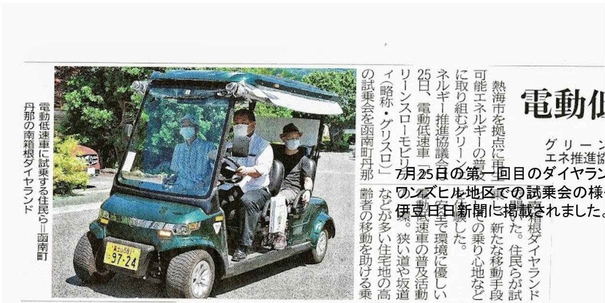
電動低速車に試乗する住民ら 函南町 丹那の南箱根ダイヤモンド